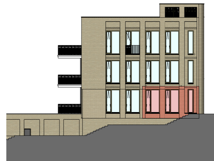
zijgevel links Schaal: 1 : 200