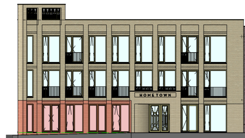
voorgevel Schaal: 1 : 200